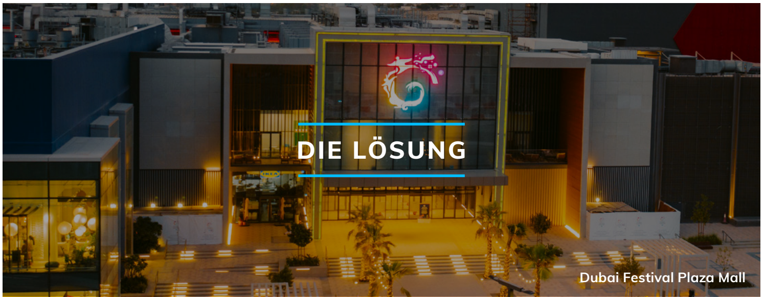
Dubai Festival Plaza Mall

Al-Futtaim Malls hat im Rahmen seiner umfassenden digitalen Transformationsstrategie Yardis Lösung für Budget- und Prognoseerstellung implementiert.